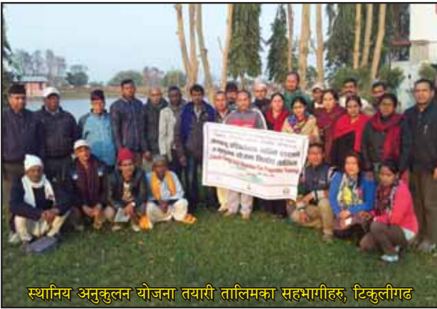
स्थानिय अनुकुलन योजना तयारी तालिमका सहभागीहरु, टिकुलीगढ