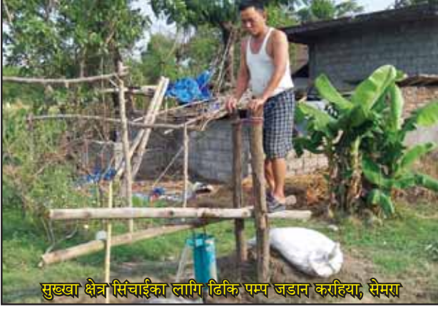
सुब्बा क्षेत्र सिंचाईका लागि ढिकि पम्प जडान करीहिया, सेमरा