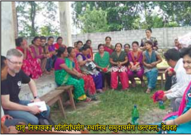
दातृ निकायका प्रतिनिधिसँग स्थानिय समुदायसँग छलफल, देवदह