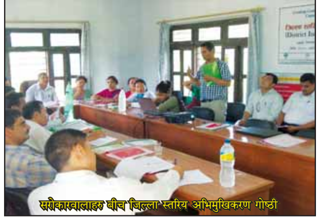
सरोकारवालाहरु बीच जिल्ला स्तरिय अभिमुखिकरण गोष्ठी