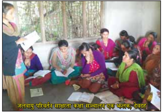
जलवायु परिवर्तन साक्षरता कक्षा सञ्चालन एक भलक, देवदह